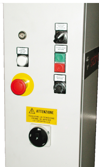
Quadro comandi Panneau des commandes Cuadro de mandos